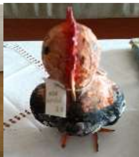
NOA KUTIČIĆ, 6. B