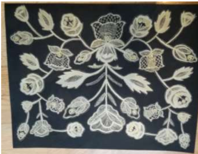
MAJA UNETIĆ, 8.A