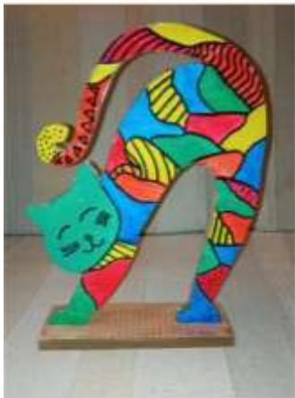
IVA KLARIĆ, 5. B