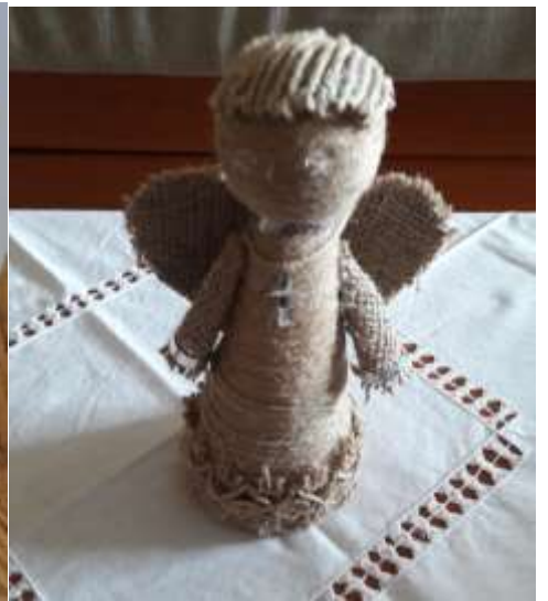
NOA KUTIČIĆ, 6.B